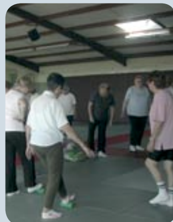
Gymnastique avec ASC