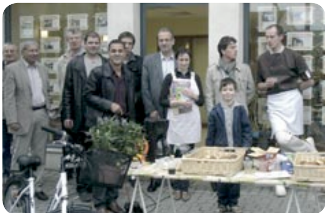
Du 8 au 18 octobre Opération « Commerces en fête »