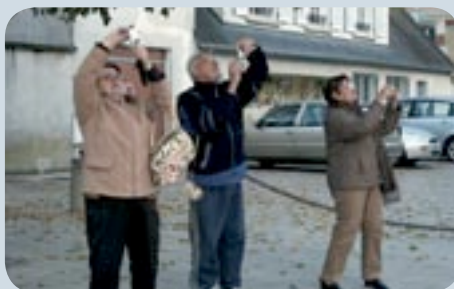
Atelier informatique et photos numériques