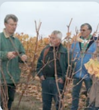
Taille de la vigne avec CAVE