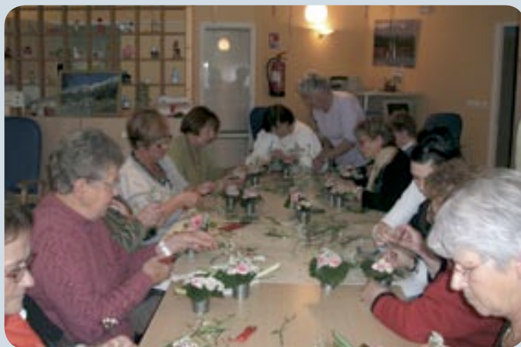
Atelier floral avec la SHOL