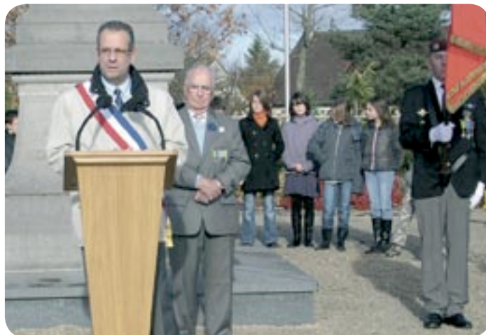
11 novembre Cérémonie de l'Armistice avec les enfants des écoles de Chécy