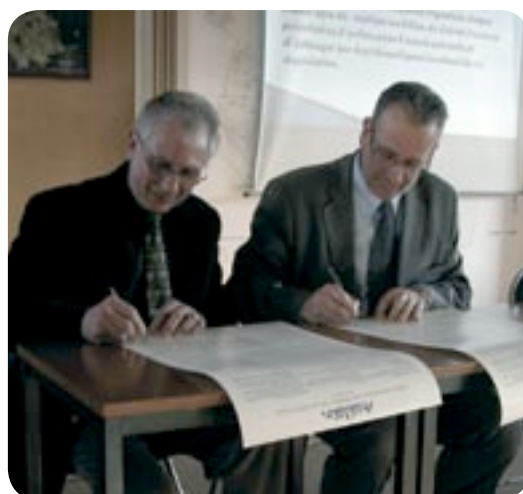
29 novembre Rencontre de la municipalité avec 53 associations présentes et signature des nouveaux statuts de l'Office Municipal des Sports