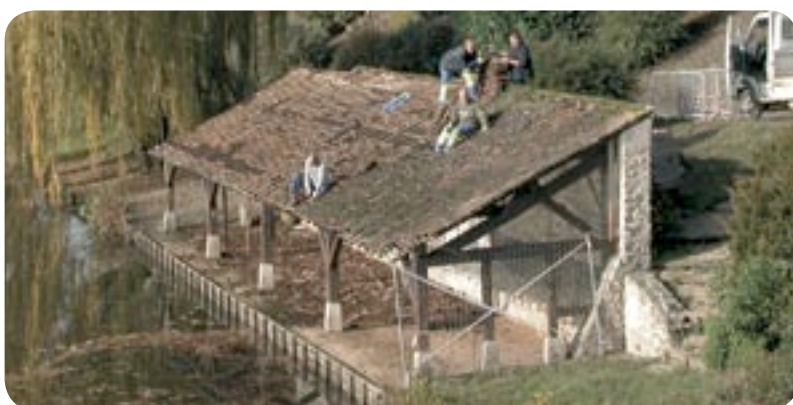
octobre - novembre Poursuite des travaux de rénovation du lavoir par les services de la ville