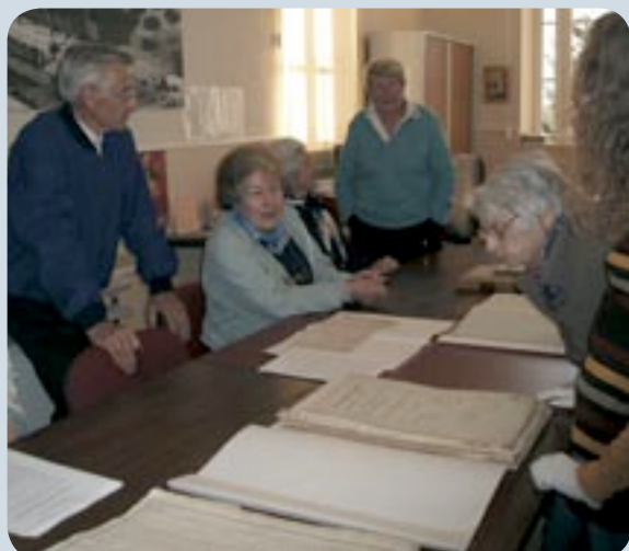
Visite des Archives municipales