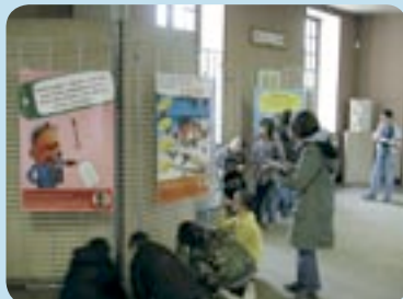
novembre Rendez-vous citoyens à la mairie, dans le cadre de la mise en place et de l'élection du « Conseil d'enfants » (le 28 novembre)