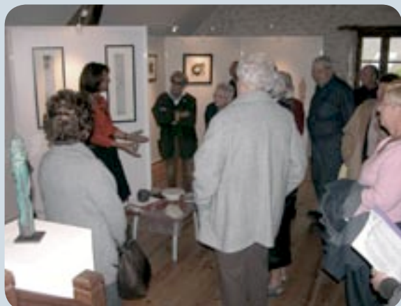
Visite de l'exposition avec CLE et le Musée de la Tonnellerie